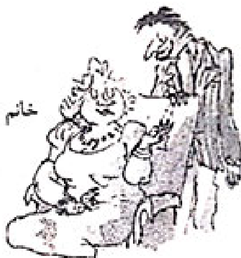
خانم و آقای ورموود