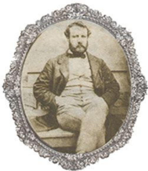
Jules Vern, 1828-1905