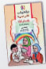
زکاتانی شایع کتابش روغن‌ها